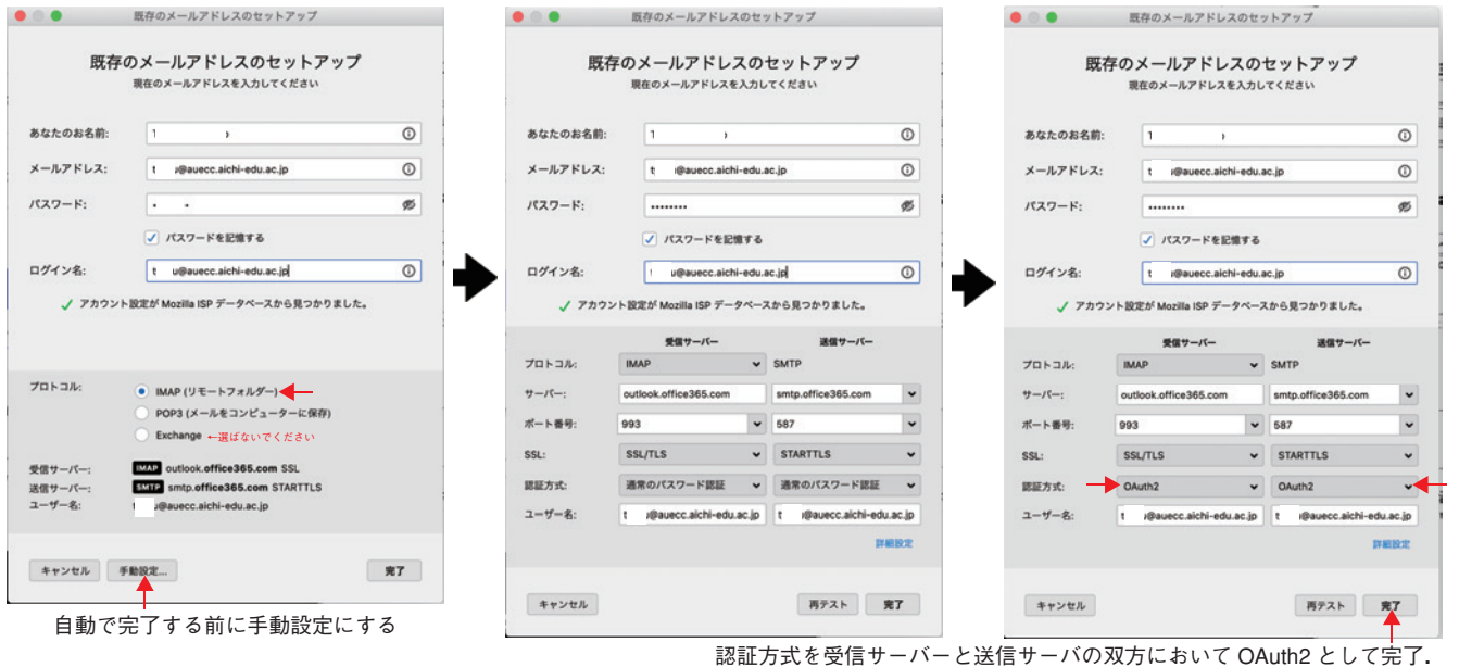
図 2: Thunderbird における OAuth2 の設定方法