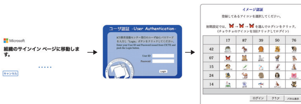
図 1: OAuth2(先進認証) 対応のメールソフトウェアにおけるアカウント設定時の認証

OAuth2 対応 (先進認証対応) のメールソフトでは、電子メールアカウントを設定するとき本学のメールアドレスを入力すると、図 1 に示すように組織のサインページに移動しますと表示され、ID とパスワードの入力に続き、イメージマトリックス認証に進みます。